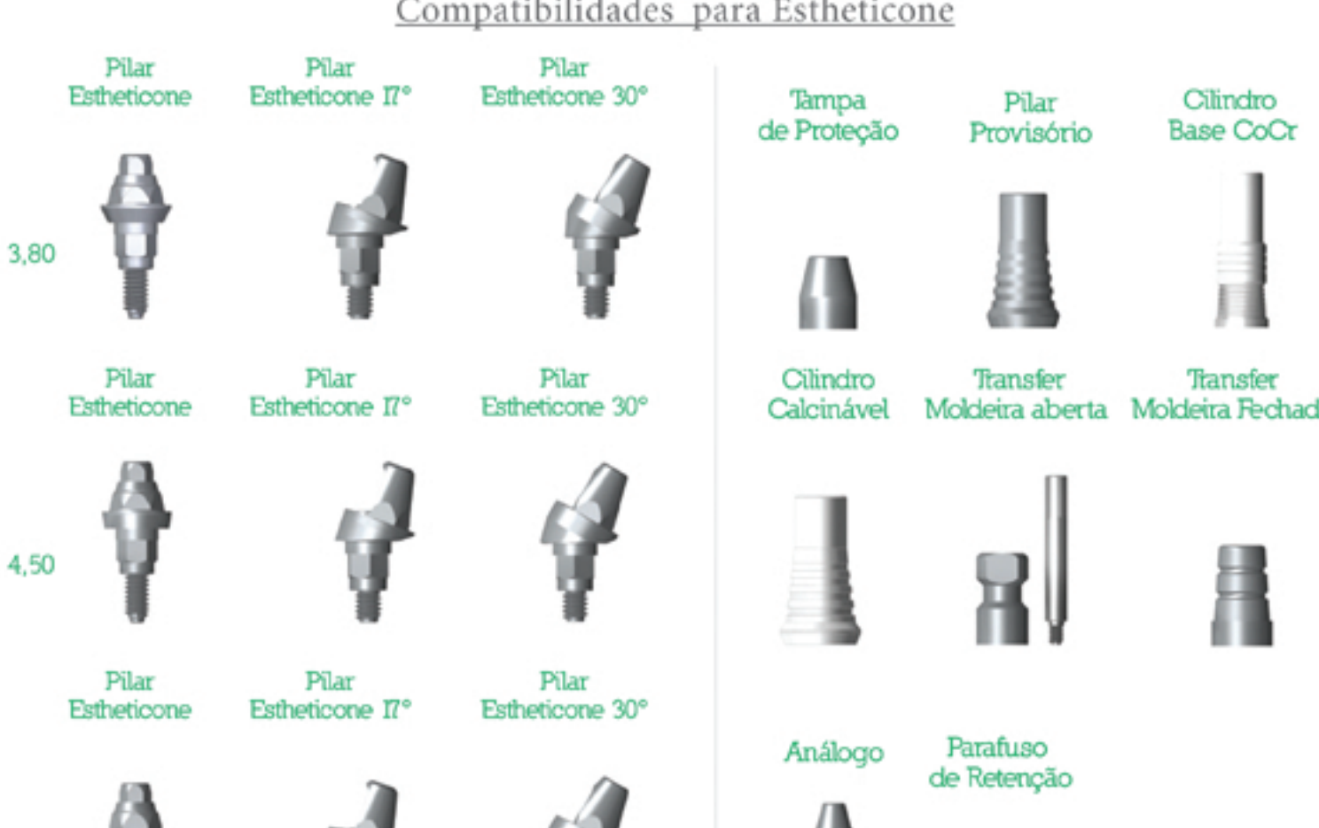
Tabela de Compatibilidades